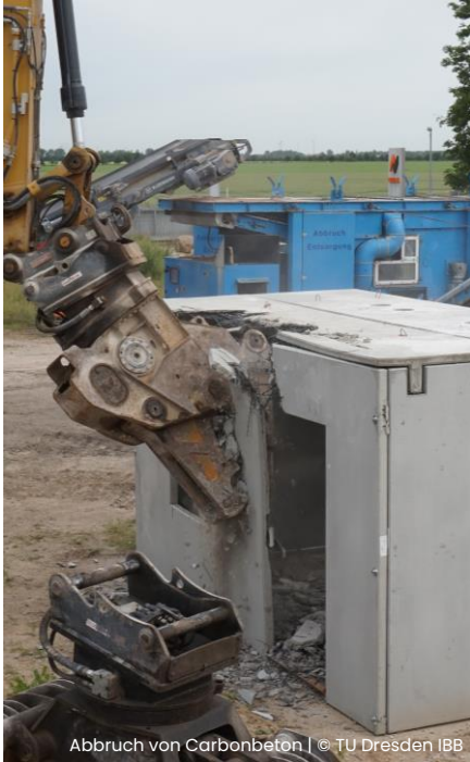
Abbruch von Carbonbeton